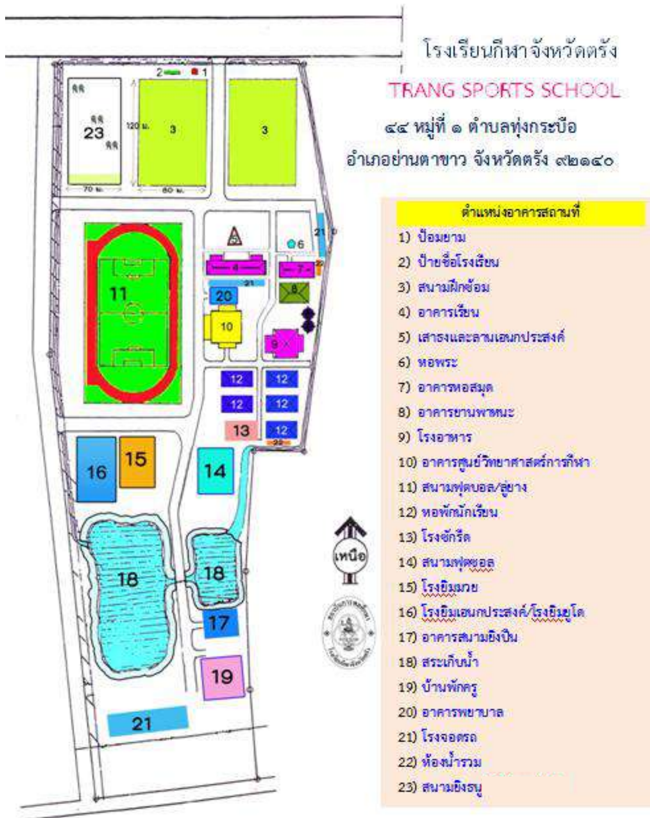
ตำแหน่งอาคารสถานที่